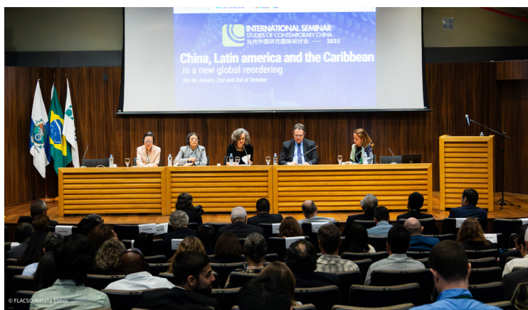
II Seminario Internacional China Contemporánea

Esta edición ofrece una lectura integral sobre las oportunidades y desafíos que enfrenta América Latina ante la evolución del enfoque chino de desarrollo, destacando la necesidad de estrategias regionales que permitan aprovechar la cooperación de “alta calidad” y fortalecer una inserción más sostenible, diversificada y estratégica del Sur Global en el sistema internacional contemporáneo.