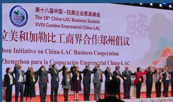
XVIII Cumbre Empresarial China-LAC

El pasado 03 de noviembre, en la ciudad de Zhengzhou, se celebró la XVIII Cumbre Empresarial China-LAC, un evento que reunió instituciones, empresarios, funcionarios, académicos y diplomáticos de más de 30 países latinoamericanos. El objetivo central del evento fue fortalecer los lazos de cooperación económica y financiera birregional en un contexto de creciente dinamización de relaciones comerciales entre América Latina y China.