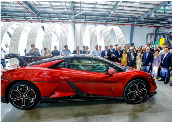
Inauguración fábrica BYD en Brasil

Mientras el comercio entre China y América Latina continúa profundizándose — alcanzando los 518 mil millones de dólares en 2024, un aumento del 6% con respecto a 2023 — las relaciones birregionales también se consolidan a través del crecimiento sostenido de las inversiones chinas en la región (Myers 2025). Estas se caracterizan principalmente por el flujo de capitales para el desarrollo de tecnologías de información y comunicación junto con la activación de plantas de construcción de vehículos eléctricos.