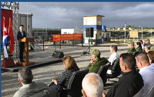
Inauguración planta fotovoltaica en Cuba

El pasado 12 de noviembre del 2025, China inauguró el séptimo parque solar en Artemisa, Cuba, como parte de un proyecto que busca integrar hasta 200 MhW de generación eléctrica al sistema de energía de la isla.