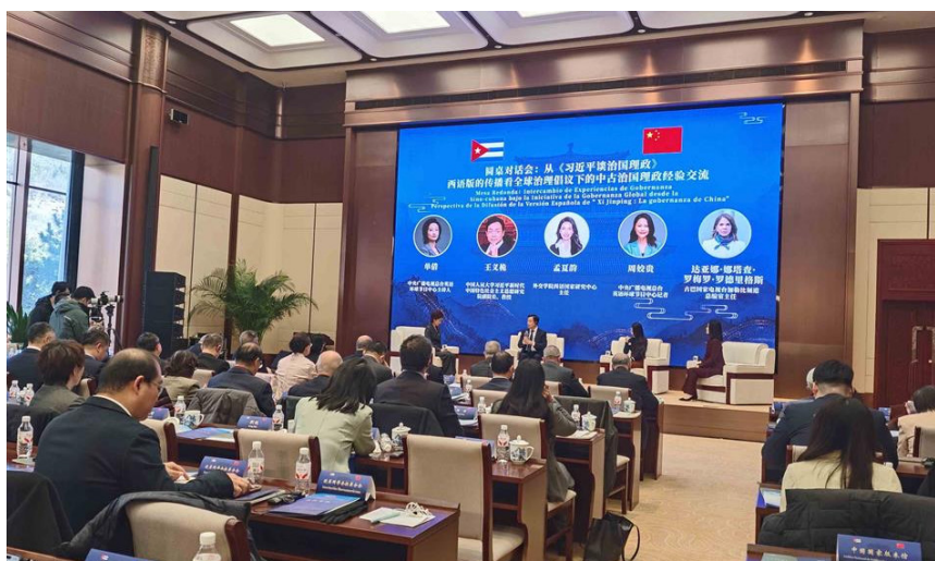
Seminario entre China y Cuba en Beijing