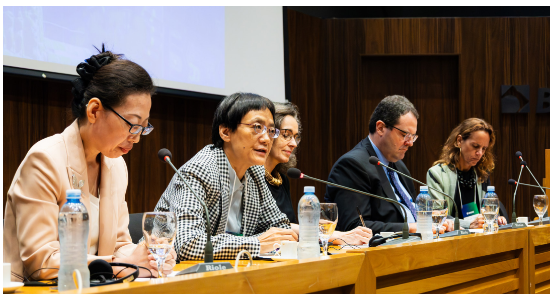
Plenaria de Autoridades II Seminario Internacional

El 2 y 3 de octubre del 2025 se celebró el II Seminario Internacional de Estudios de China Contemporánea de la Cátedra china Contemporánea el cual tuvo como temática “China, América Latina y el Caribe en el nuevo reordenamiento global”. Celebrado en la sede del Banco Nacional de Desarrollo Económico y Social (BNDES) en Río de Janeiro, Brasil, el evento fue organizado por la Secretaría General de FLACSO y el BNDES.